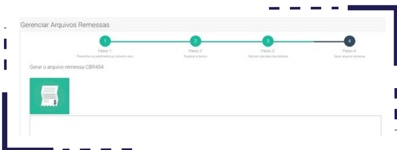
print de parte da tela do Sistema

O Sistema SISCOB faz a geração do Arquivo Remessa para o envio das faturas ao banco. Padronizado no modelo CBR454, o Sistema faz o preenchimento dos parâmetros para o próximo ano, duplica o banco, calcula as parcelas dos boletos, até a geração do arquivo final para envio das cobranças.